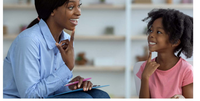
Bir dil terapisti, eğitim seansı sırasında genç bir kızla çalışıyor.