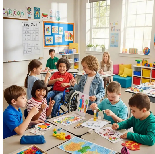
Kapsayıcı Sınıflar: Eğitimciler ve Aileler İçin İpuçları