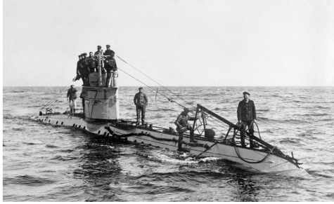
Görsel 2: Dönemin Savaş Gemileri ve Deniz Operasyonları